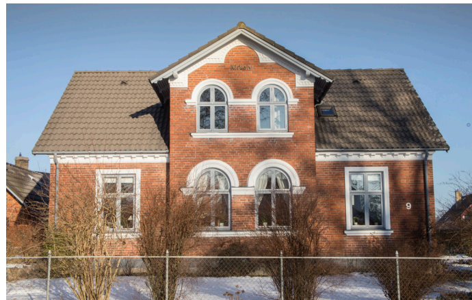
Huset Kirkely i Stenløse, der er et eksempel på bedre byggeskik.

I Stenløse by kan man opleve fine eksempler på arkitektur fra en række forskellige perioder.